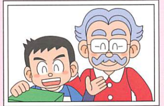
げんちゃん ピグマはかせ